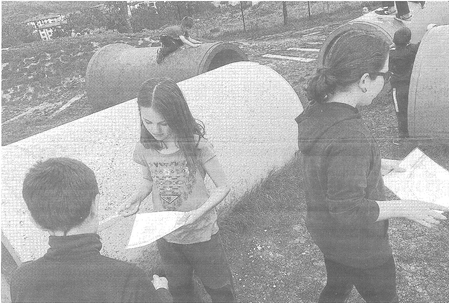
Oreka proiektuan, gai desberdinekin lotutako jarduerak egiten ditugu.

G orputz hezkuntza, ikaslearen garapen integralaren zutabeetako bat da, garapen horretan integratua joan behar duena. Hori dela eta, tradizionalki ariketa fisikoarekin bakarrik erlazionatu den arlo honi, testuinguru bat eta ikuspegi orokorrago bat eman nahi dio orekaz proiektuak. Ikaslearen behar eta interesetara egokitzuz, sormena eta autonomiari protagonismoa emanez eta zeharkako gaiak landuz. Garapen pertsonala, norberaren jokabide motorretik sustatuz norberarengandik besteengana eta kulturarako bidea egitea da arloaren ikuspegia.