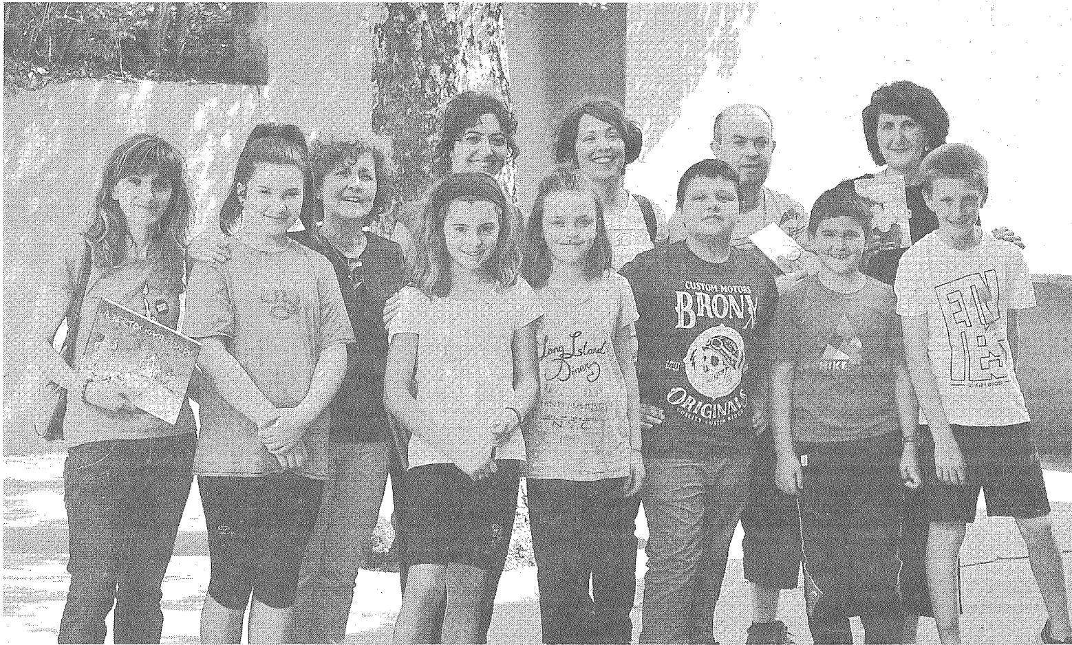
Tantirumairu Ikastolara etorri ziren irakurleak, 5. eta 6. mailako ikasleekin batera.