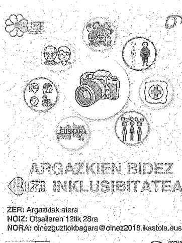
Argazki lehiaketaren kartela.

Urtean zehar antolatu diren jarduerak eta proiektuetan inklusibitatea kontuan hartzen ahalegintzen ari gara, gizartean gai honekiko sentsibilizazioaren zabalkuntza lagunduz. Inklusibitatea zehar lerroa bilakatu da gure jardunean eta asko dira dagoeneko egin diren internetzioak: jarduerak eta ekitaldiak zeinu hizkuntzaz jarraitzeko aukera iza-