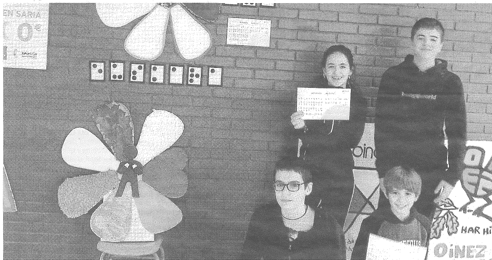
Inklusibitatea lantzen ari gara ikasturte honetan.