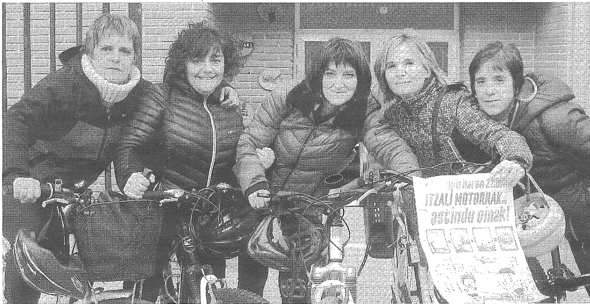
Ikastolaren jasangarritasunaren alde lan egiten ari den guraso taldea.

Gure ikastolan garrantzia handia ematen diogu iraunkortasunaren sustapenari. Hala, guraso talde bat arduratzen da gai hau lantzeaz.