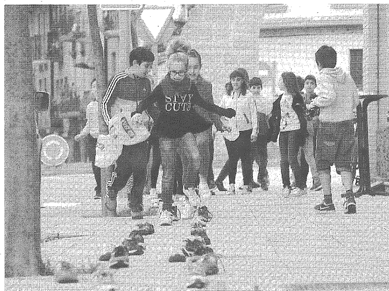
Zangozako Ikastolak antolatutako ekimenetako bat.

helburuak hauek dira: Zangoza herrian gero eta kotxe gutxiago erabiltzea ikastolara etortzeko, eta Udala eta mankomunitatearekin harremanak eta elkarlana sustatzea; guraso eta ikasleen aldetik baso jasangarriaren jarraipena egitea eta Oinez Basoko mantentze lanetan parte hartzea; ikastolaren eraikuntzaren plangintza energetikoa aurrera eramatea, geroz eta jasangarriagoa izan dadin; hezkuntza komunitatearen partaidetza guztia informatua izatea; eta arlo kurrrikularrean ikasleak ingurugiroaren hezkuntzan konpetenteak egitea inguruarekiko erabaki arduratsuek hartzeko gaitasunak garatuz.